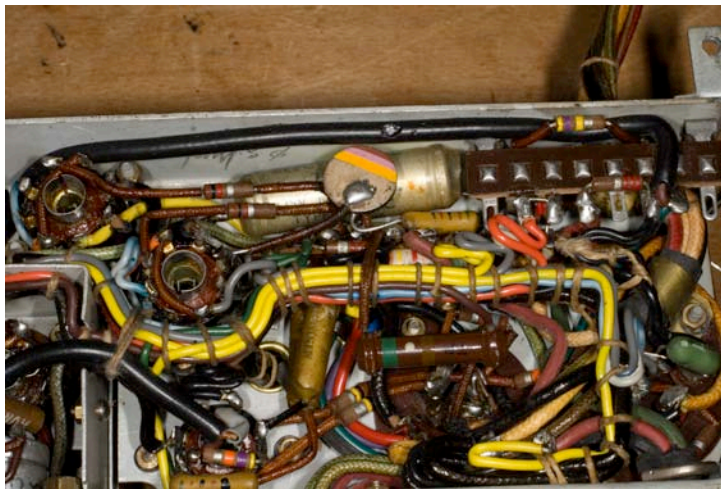
De nieuwe thermistor op zijn plaats (midden boven) in de Dictaphone versterker

Is de hierboven doorgemeten thermistor bruikbaar? De weerstand is koud 470 \Omega , zodat de inschakelstroom 120/660 = 0.18 \text{ A} is, bijna 2 maal de streefwaarde (ik heb geen gegevens kunnen vinden over de maximaal toelaatbare inschakelstroom van gloeidraden).